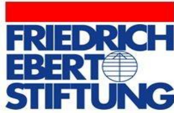
フリードリヒ・エーベルト財団東京事務所